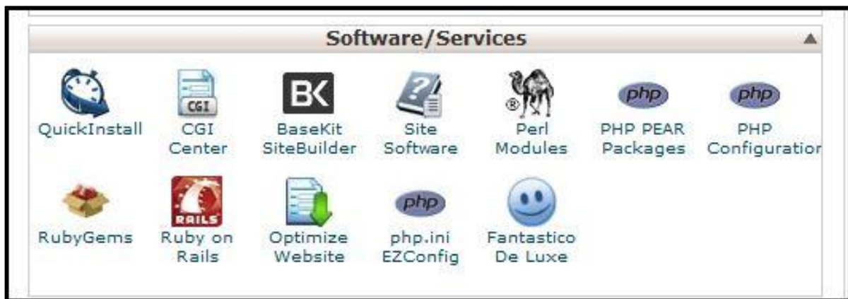
شكل 2.4 صورة تمثل جزءاً من لوحة التحكم الخاصة بالموقع

حيث أن yourdomain.com يمثل اسم الموقع الذي حجزته سابقاً. سوف تظهر نافذة تطالبك بإدخال اسم المستخدم وكلمة السر. وكلاهما موجودان في الرسالة التي قام الموقع بإرسالها إليك مسبقاً عند إتمام تسجيلك. بعد إدخالك لاسم المستخدم وكلمة السر ستظهر لوحة التحكم. انزل قليلاً إلى التبويب: البرامج/الخدمات Softwares/Services واختر منها Fantastico De Luxe كما هو موضح في الصورة: