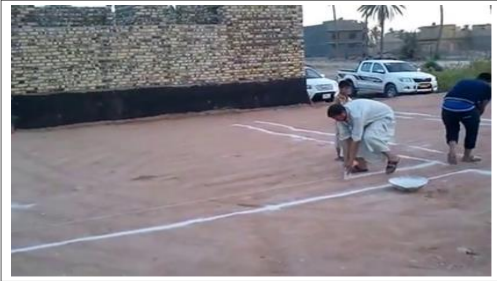
صورة رقم (٥) عملية تخطيط الموقع

بعد الانتهاء من فرش طبقة الحصى الخابط وحدها والتأكد من وصولها الى نسبة الحدال المطلوبة سواء عن طريق الفحص المخبري وهو الافضل طبعا او عن طريق خبرة المهندس المشرف، تنم المباشرة بأعمال تسقيط الخارطة على الارض (النخطيط) وذلك على يد مساح ذي خبرة كافية للحصول على مخطط نظامي مطابق للخارطة التي تم تصميمها سابقا . وينت استخدام الخيط والبورك او الجص في اجاز عملية النخطيط. وكما مبين في الصورة .