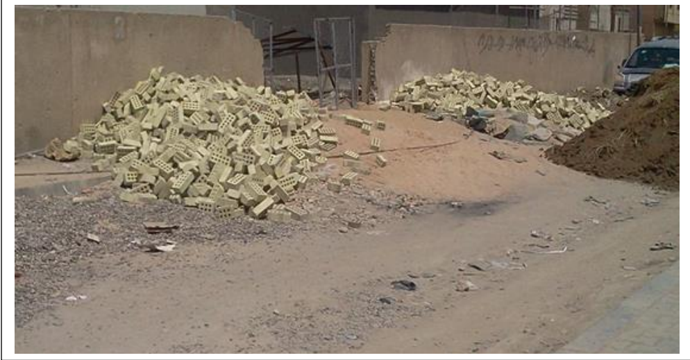
صورة مرقم (٦) تداخل أكياس الرمل والحصى والطابوق والتراب في موقع العمل