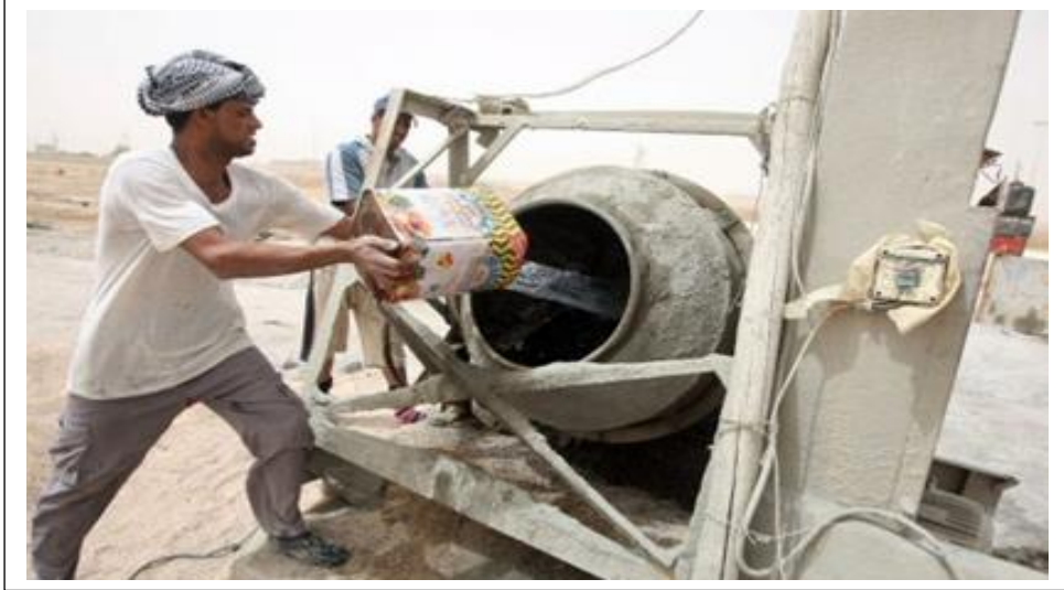
صورة مرقم (٩) خباطة الخرسانة الموقعية

١٣- يجب تجهيز عدد من الحباطات اليدوية يتناسب وحجم العمل واناجية الحباطات لضمان الجاز الصب بوقت مبكر.