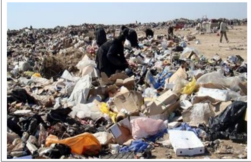
صورة مرقم (٣) أمراض داخل المدينة تحولت الى مكب نفايات

٢- ان الكثير من الامراضى المحيطة بمركز المدينة كانت متروكة لفترة طويلة وقد اصبحت تبعا لذلك مكبا للنفايات والاساخ المختلفة كالعلب الفارغة والمواد المختلفة من اقمشة ومخلفات غذائية ومواد حديدية وبلاستيكية ومواد عضوية وغيرها . وان هذه المواد تكون في حالة عدم معالجتها أخطر من النوع الاول الذي ورد في الفقرة السابقة كون العلب والمواد الغذائية والاقمشة والمواد الكرتونية سريعة التلف والتسسخ.