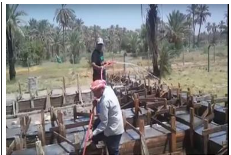
صورة مرقم (٢) حمار سكاني يشيد على أرض زراعية