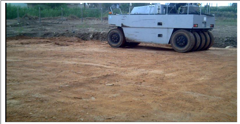
صورة رقم (٤) حادلة مطاطية تستخدم لحدل الحصى الخابط

٢- ان اختلاف المقالع ونوعية موادها ينعكس على اسعارها ايضا وكذلك على اماكن استخدامها كونها مصنفة هندسيا لهذا الاجزاء. فمنها ما يستخدم للدفن فقط ومنها ما يستعمل للدفن بنسبة حدل (٨٥-٩٠) % ومنها ما يستعمل لأعمال تتطلب نسب حدل عالية قد تصل الى ٩٨%. ان كل ما ذكرناه تحدد الفحص المخبري للحصى الخابط المجهز وذلك بأخذ عينة من المادة وارسالها الى المخبر لفحصها والتأكد من مدى مطابقتها للاستخدام وفق ما مطلوب.