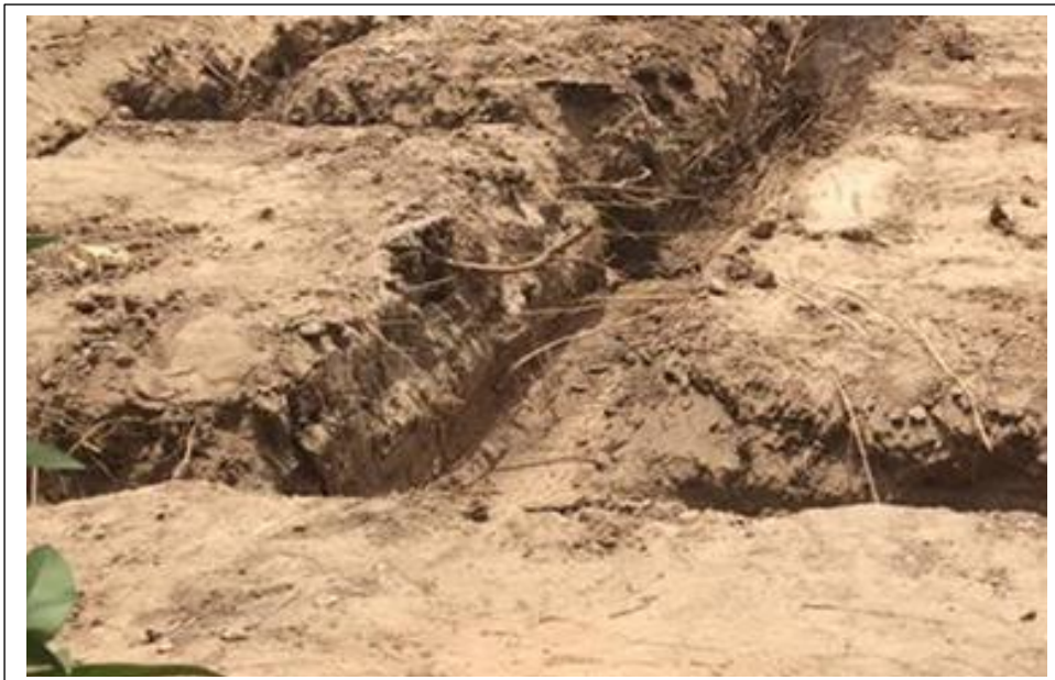
صورة مرقم (١) حفن الأسس في أرض زراعية مليئة بخضور النباتات

العليا من قطعة الأرض فقط، وقد لا يقوم بذلك أصلاً ثم يبدأ بعملية الدفن باستخدام التراب أو الحصى الخابط وحده تلك الطبقات وهو لا يعلم بما موجود تحت تلك الطبقات.