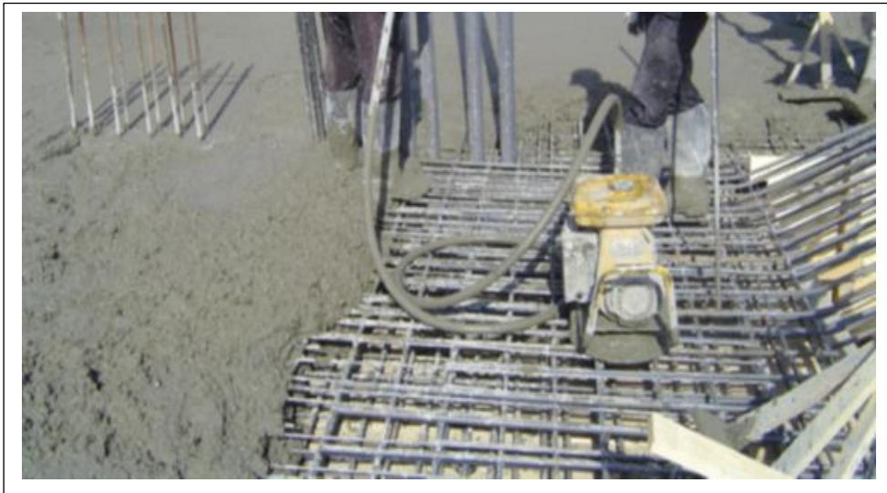
صورة مرقم (١٠) الهزاز المستخدم لرص الخرسانة

١٢- توفير الهزازات الخاصة برص الخرسانة بما يضمن وجود البديل في حالة حدوث العطل