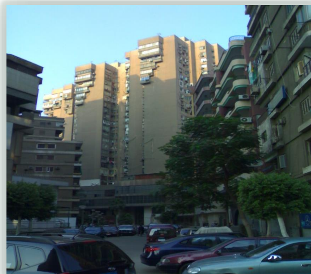
أبراج أغاخان لا تسمح بالامتداد الرأسى لأن الأبراج عالية بحالتها الطبيعية دون أي تدخل .