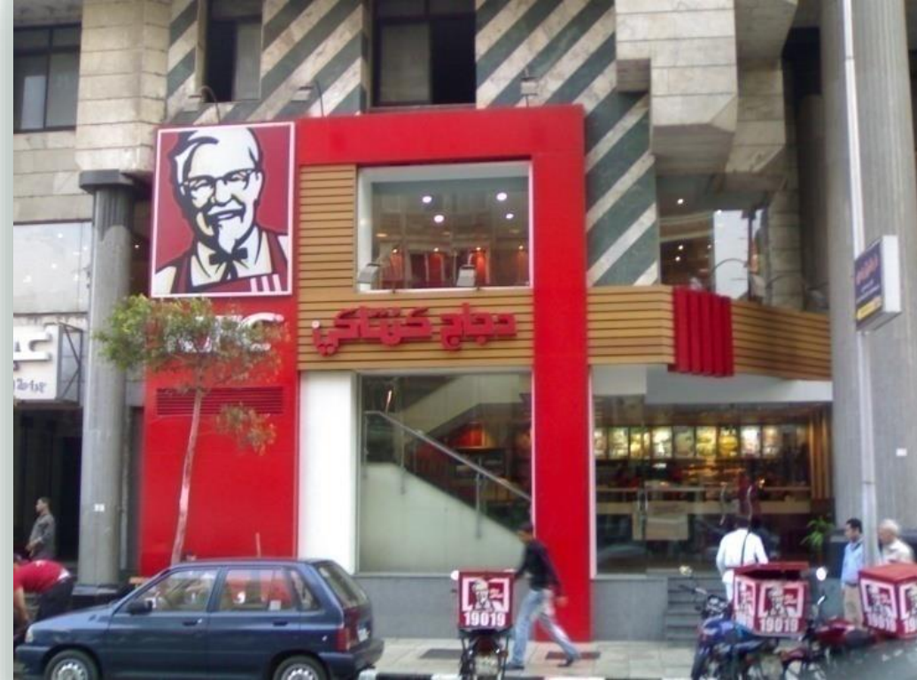
الخدمات الغذائية في المنطقة