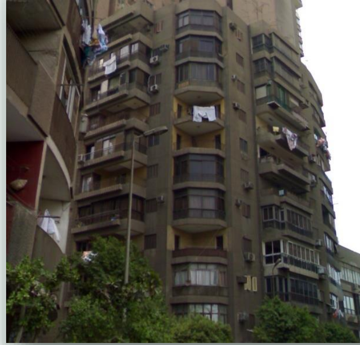
احد الابراج في المنطقة