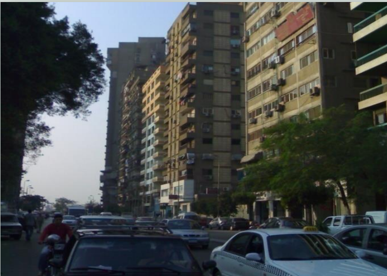
ابراج عالية في الشوارع الرئيسية