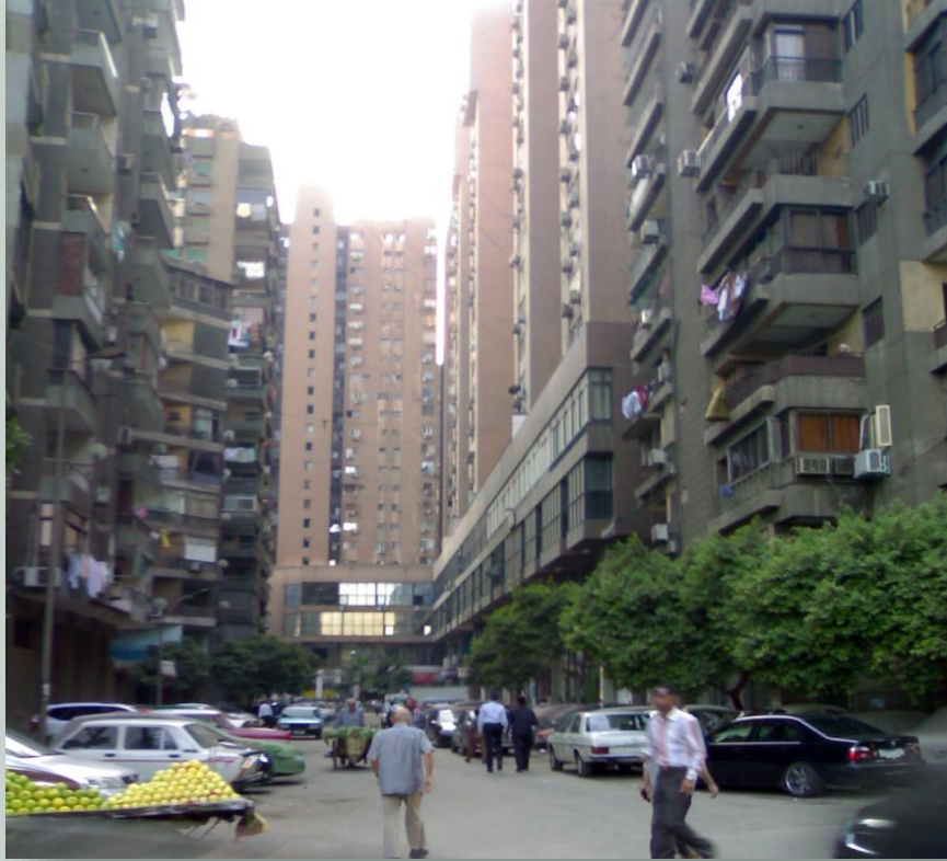
الازدحام يؤثر على سلوك السكان