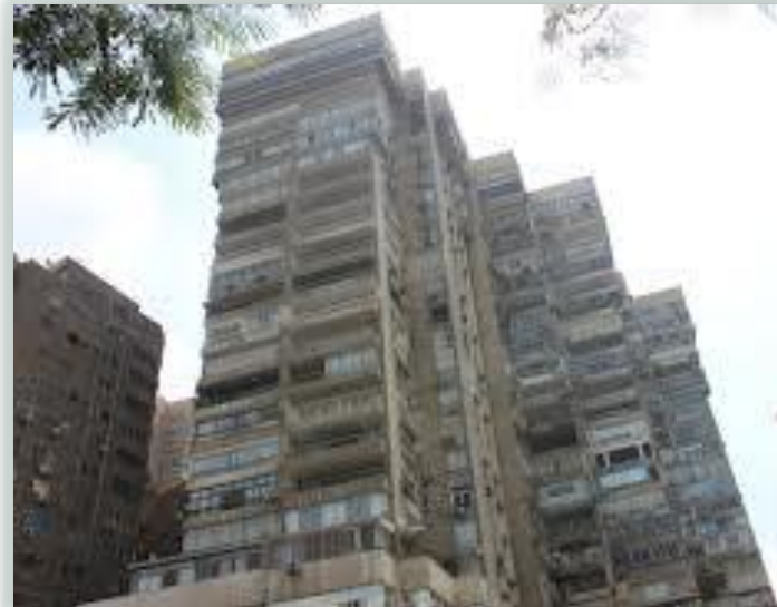
ابراج عالية تطل علي النيل