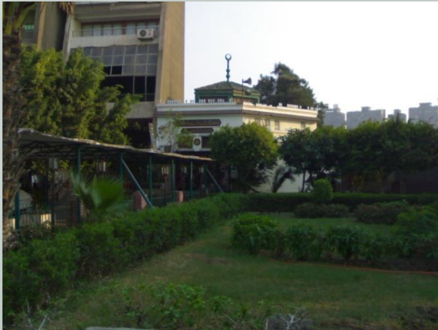
صورة توضح فقد الرموز الانسانية مثل ارتفاع الجامع