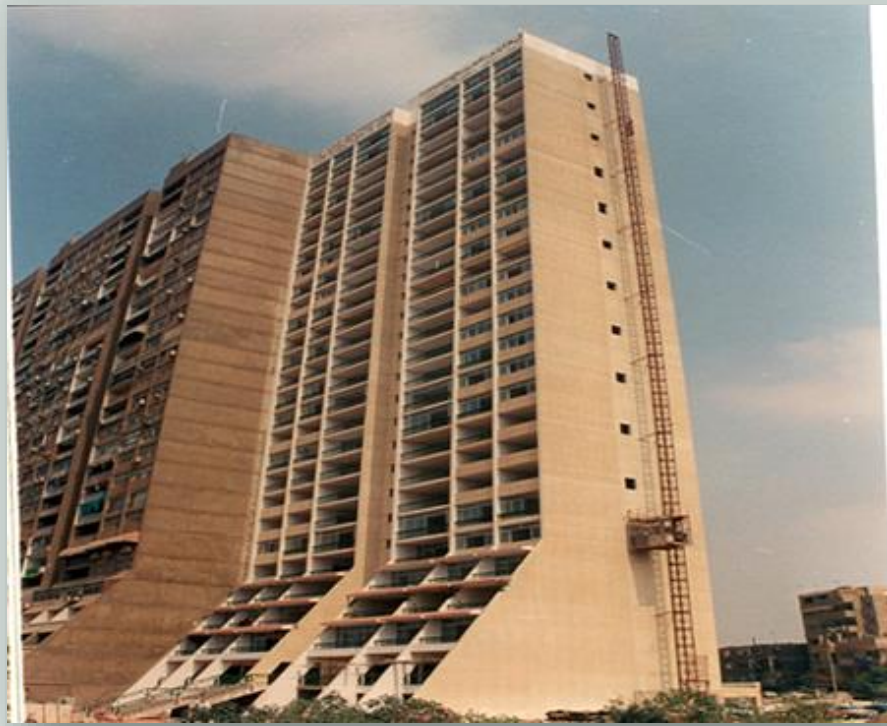
صورة لارتفاع المباني