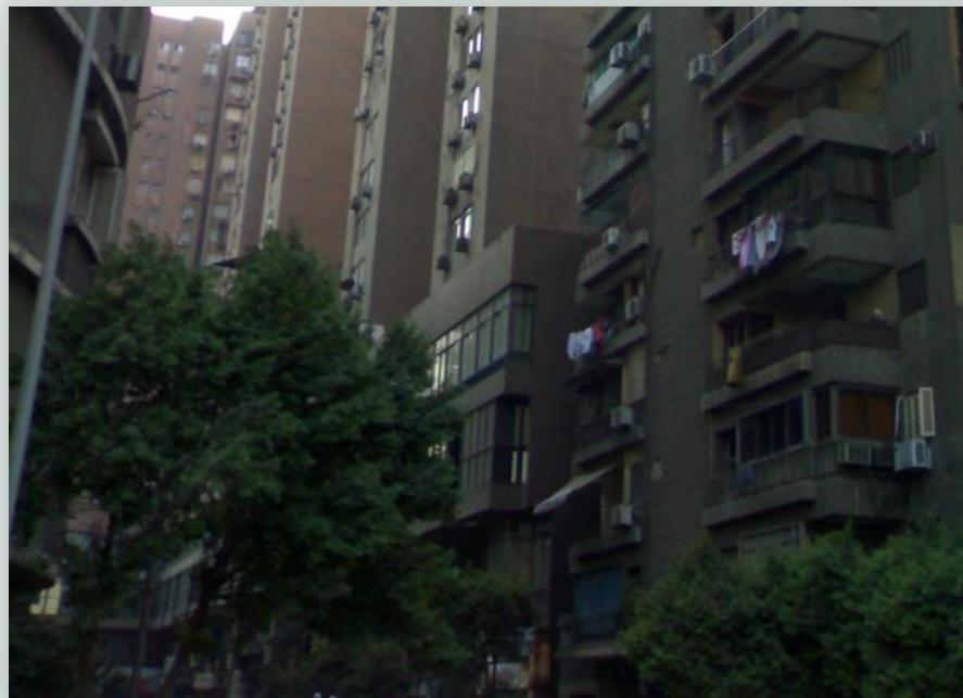
انخفاض الإضاءة أدى على عدم الشعور بالأمن