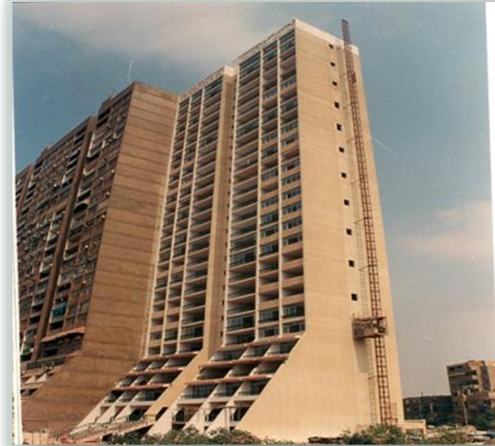
صور توضح مدى افتقاد المقياس الانساني في هذه الابراج العالية