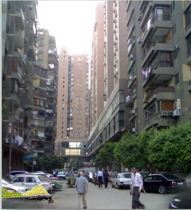
الارتفاعات الشاهقة للمباني و غياب العلاقات الاجتماعية