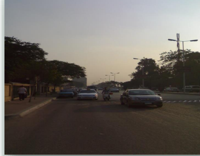
وجود السجادة الأسفلتية