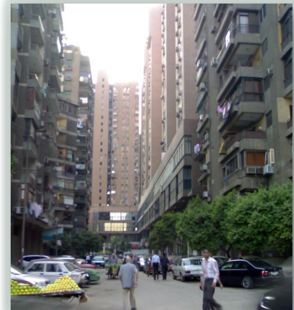
اهمال اهمية الشارع بوجود الباعة الجائلين وتعطيل حركة مرور السيارات