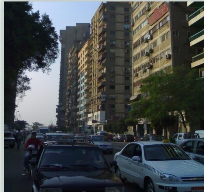
كثافة شبكات الطرق