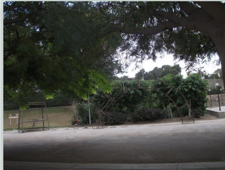
اهمال الحدائق وعدم الاهتمام بها وعدم تطويرها