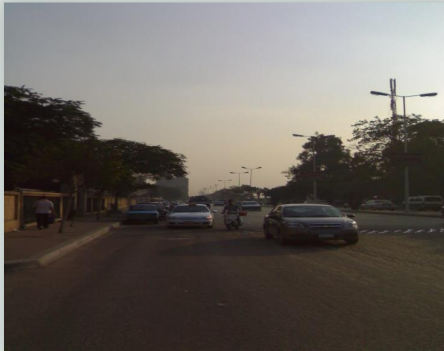
عدم احترام المقياس الانساني

متقاعد - رجل كبير (( الحكومة مش مهتمة باناره الشوارع الجانبية ))