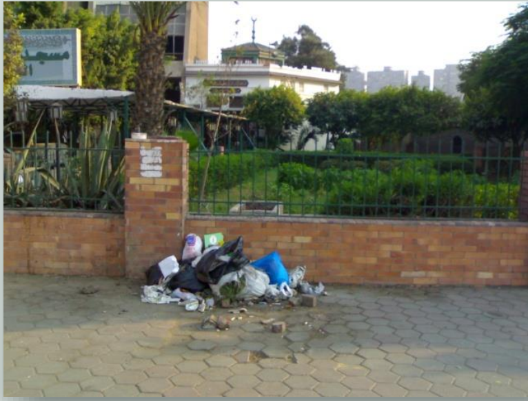
اهمال الحدائق وضياع اهميتها بوجود القمامة

2. اهمال اهمية فراغ الشارع والميادين العمرانية والحدائق