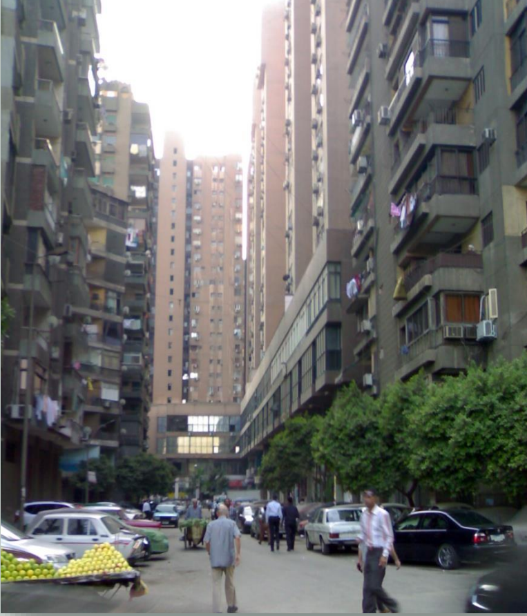
انتشار راسي في احدي الشوارع بمنطقة اغاخان

• وكانت اسباب الانتشار الراسي وليس الافقي لكثرة الاحتياج الي السكن وعدم وجود فاغات وتخطيط للانتشار الافقي وبالتالي اصبح الانتشار راسي .