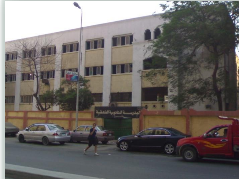
افتقاد وضوح الصورة الذهنية