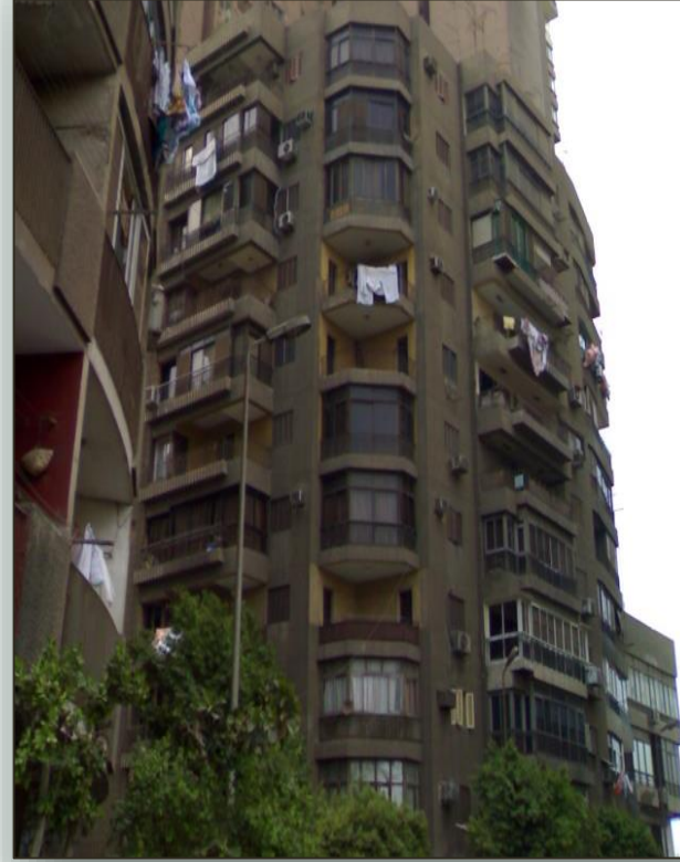
أبراج أغاخان لا تسمح بالامتداد المستقبلي الأفقي