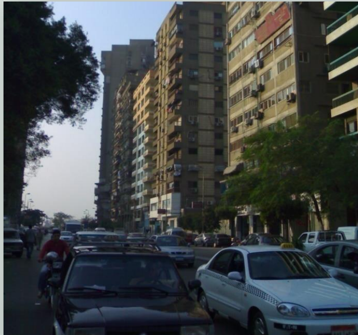
التكدس المروري أحد عيوب هذه المنطقة

و يتضح في نقد عام الي عمارة الحداثة أهمية مراجعة معني ووظيفة الشارع الحقيقية و محاولة إعادة الشارع القديم و استخداماته في الحياة الحديثة