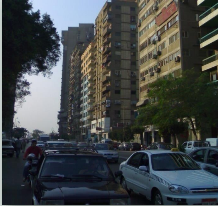
صورة توضح التكدس والازدحام المروري بالسيارات