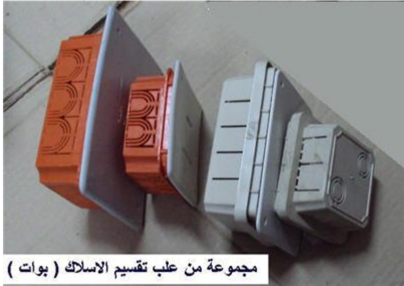
مجموعة من علب تقسيم الاسلاك ( بوات )