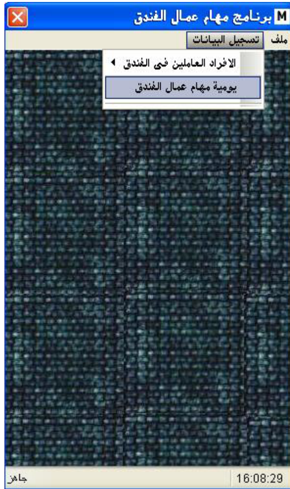
شكل (5) فتح نافذة اعداد ومراجعة يومات مهام العمال في الفندق