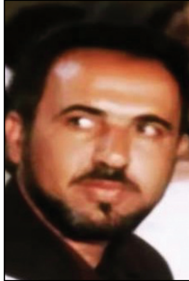
الإرهابي صالح سرية زعيم تنظيم «الفنية العسكرية»