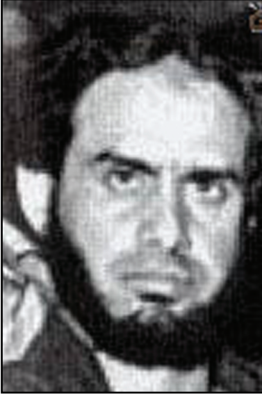
الإرهابي شكري مصطفى زعيم تنظيم «التكفير والهجرة»