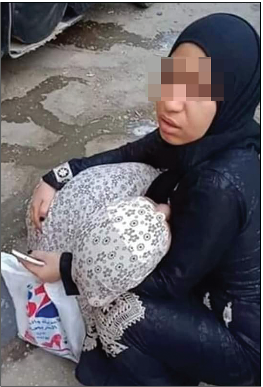
تحمل أمها المريضة أمام المستشفى في انتظار الفرج!!