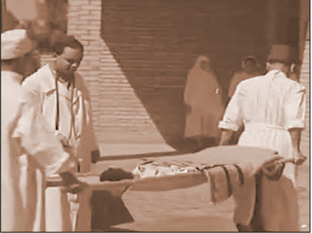
في جانحة الكوليرا سنة ١٩٤٧ .. أطباء مصريون يكافحون من أجل إنقاذ حياة مصاب