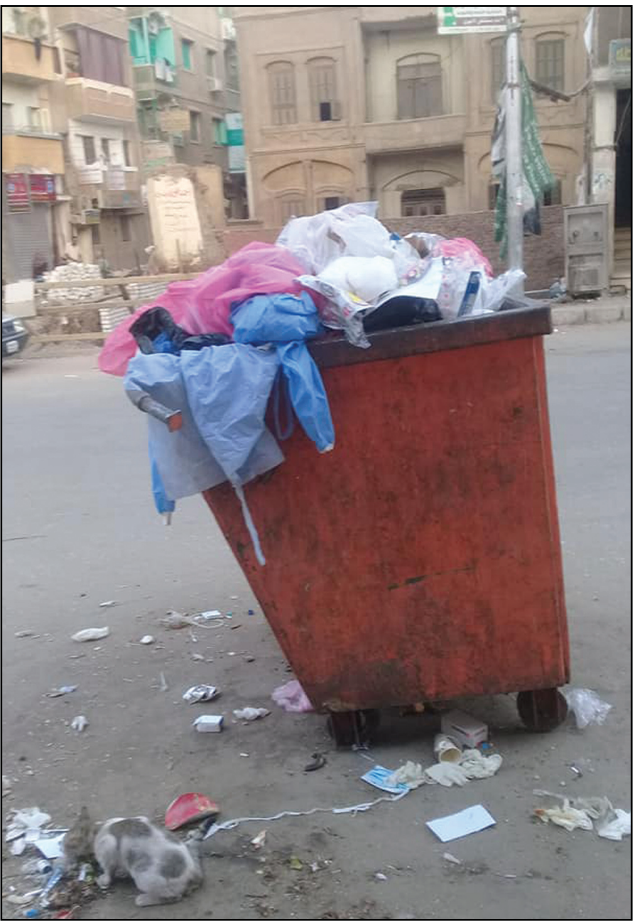
النفائات الطبية في نهر الشارع أمام مستشفى سوهاج العام