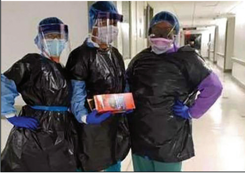
أعلى : أطباء أمريكيون يلبسون أكياس القمامة السوداء بديلاً عن نقص البدل الوقائية أسفل : ممرضات إنجليزيات يلبسن أكياس القمامة الزرقاء بديلاً عن نقص البدل الوقائية