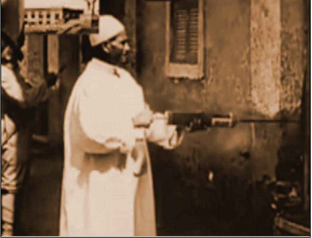
فريق من الطب الوقائي يقوم برش المنازل والطرقات بغبار الكبريت